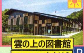
雲の上の図書館 YURURIゆすはら