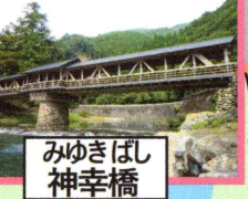
みゆきばし 神幸橋