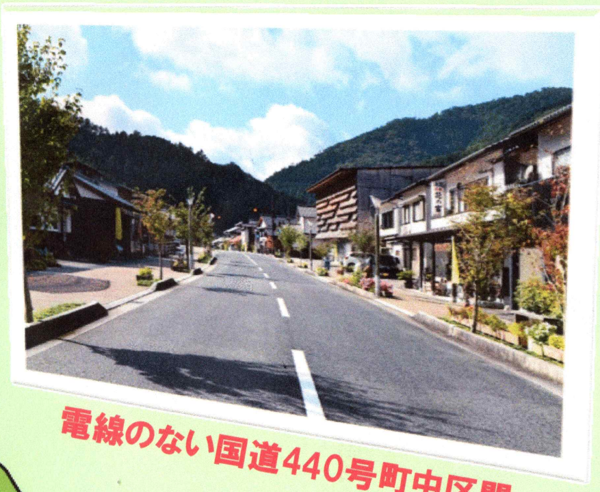
電線のない国道440号町中区間